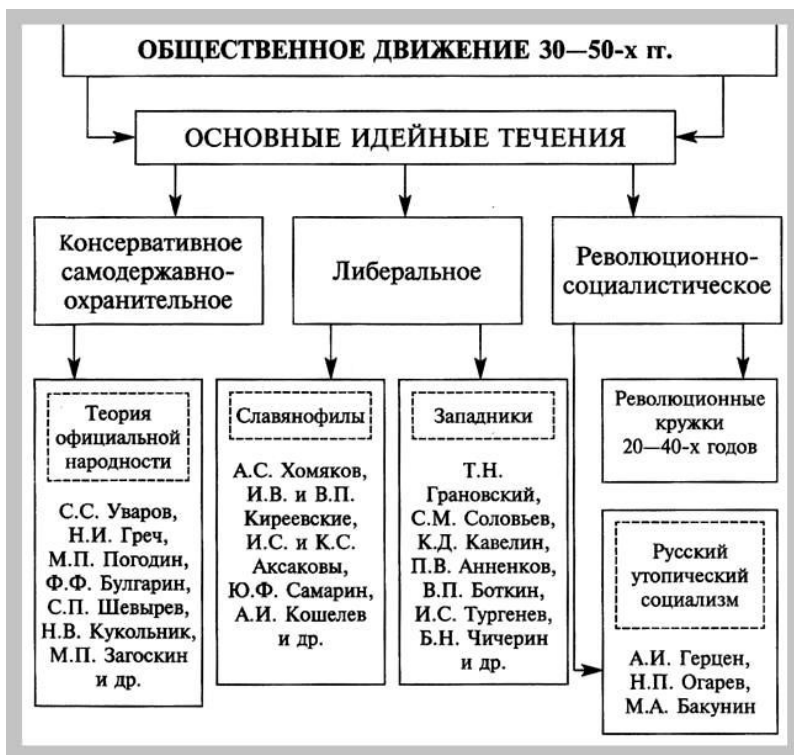
Рис. 4.1. Схема «Общественное движение 1830 – 1850-х гг.»

(Общественное движение 1830 – 1850-х гг. // Кириллов В.В. Отечественная история в схемах и таблицах. – М. : Эксмо, 2005. – С. 165.)