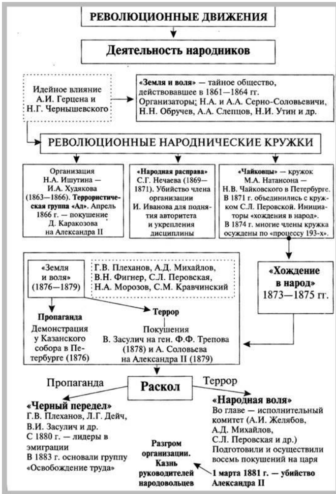
Рис. 4.2. Схема «Революционное движение в России в 60–70-е гг. XIX в.»

(Революционное движение в России в 60–70-е гг. 19 в. // Кириллов В.В. Отечественная история в схемах и таблицах / В.В. Кириллов. – М.: Эксмо, 2005. – С.192).